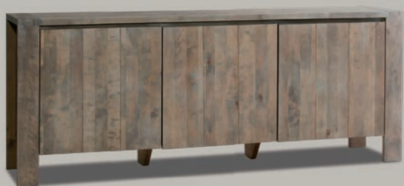
6322/52 SIDEBORD 3-TÜRIG | LINKE, MITTLERE UND RECHTE TÜR MIT JE 1 FACHBODEN | B200 T45 H81