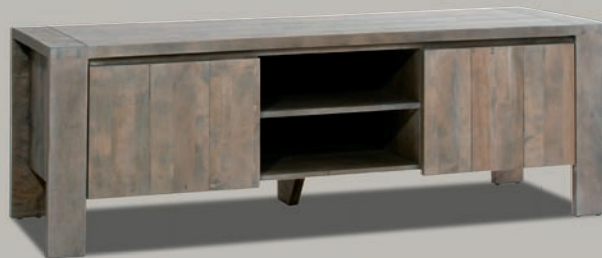
6324/52 TV-SCHRANK | LINKE UND RECHTE TÜR MIT JE 1 FACHBODEN UND AUSSPARUNG FÜR KABEL | MITTE 1 KONSTRUKTIONSBODEN | MASSE OFFENE FÄCHER: B47 T52 H15 | B160 T55 H56