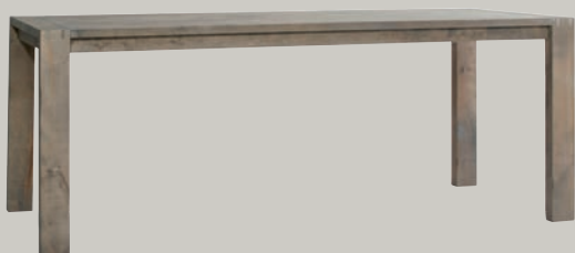
ESSTISCH PLATTENSTÄRKE: 30 MM | STOLLEN: 10X6 | 6373/52-200 L200 B90 H78 6373/52-180 L180 B90 H78 (O.ABB.) 6373/52-160 L160 B90 H78 (O.ABB.)