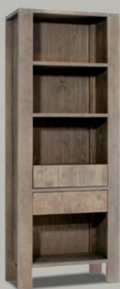
6323/52 REGAL | 3 KONSTRUKTIONSBÖDEN | 2 SCHUBLADEN | B75 T35 H195